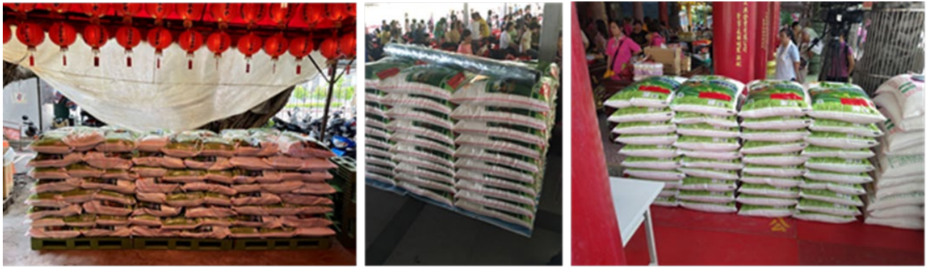
每年固定節日捐贈各廟宇白米，藉以救助當地信眾

皇翔建設為留存中華傳統文化刻苦耐勞、守禮重義的精神，每年配合在地各廟宇於固定節日或祭典時捐贈白米，藉以救助當地信眾，使信眾能依其信仰獲得協助，本公司經統計於 111 年 8 月捐贈台北市天后宮白米 4 仟台斤、林口區竹林寺白米 6 仟台斤、新莊區地藏庵白米 1 仟 5 百台斤、台北市 228 公園土地公廟白米 6 仟台斤，藉此希望能將愛心及物資轉為分享，期盼能盡一己之力，幫助需要幫助的人。並定時捐贈救濟物資如個人電腦設備、食品等予偏鄉育幼院、教養院等弱勢團體或社福單位。