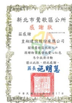
冬令救濟活動感謝狀